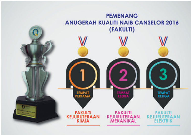
Rajah 14: Juara Keseluruhan AKNC 2016