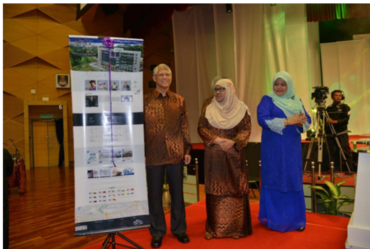
Rajah 2: Majlis pelancaran laman web UiTM yang baharu

Laman web baharu UiTM yang dibangunkan ini adalah selari dengan perkembangan laman web masakini. Ia memberikan satu momentum atau impak yang positif kepada warga UiTM khususnya dan masyarakat luar amnya. Dengan ini, laman web baharu UiTM menjadi alat yang menyokong dan berkeupayaan merealisasikan UiTM menjadi sebuah universiti yang tersohor di mata dunia dengan mengamalkan pengurusan secara digital.