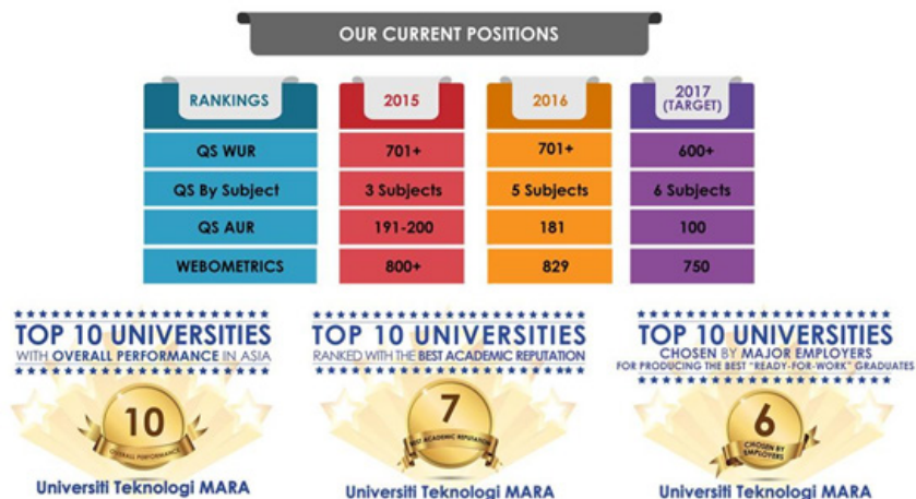
Rajah 3: Pencapaian semasa penarafan universiti

Keputusan QS By Subject yang dikeluarkan pada 22 Mac 2016 telah menunjukkan UiTM memperbaiki kedudukan dengan memperolehi 5 subjek disenaraikan untuk tahun 2016 berbanding 3 subjek bagi tahun 2015.