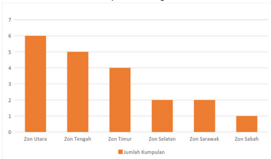
Rajah 7: Bilangan kumpulan bagi setiap zon yang terpilih ke konvensyen KIK Peringkat UiTM

Buat pertama kalinya juga, pertandingan KIK All Stars telah diadakan bagi mengiktiraf projek-projek KIK yang telah dihasilkan sejak tahun 2005 sehingga kini dan berimpak tinggi. Penyertaan yang diterima amat memberansangkan. Terdapat 36 penyertaan daripada seluruh UiTM. Kumpulan yang berjaya mengungguli anugerah ini buat pertama kalinya adalah Kumpulan INFO-10 daripada UiTM Johor. Kumpulan ini telah menghasilkan produk yang diberi nama MyDocShelves yang merupakan satu produk yang mendigitalkan dokumen konvo dan dimuatnaik sebagai aplikasi digital yang mampu dicapai secara mudahalih.